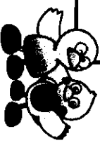
コバトンとさいたまっちゃん

【こんな疑問にお答えします！ 各Rの民間団体はどんな活動をしているの？ フリースクールって何？ どんなことをしてもらえるの？】