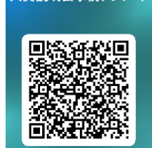
大貫説明会事前アンケート